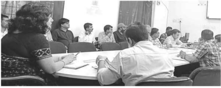
जागरूक टाइम्स संवाददाता

सिरोही। जिला कलेक्टर शुभम चौधरी की अध्यक्षता में सोमवार को डीओआरटी सभागार में साप्ताहिक समीक्षा बैठक का आयोजन हुआ। बैठक को संबोधित करते हुए जिला कलेक्टर ने सभी विभागीय अधिकारियों को जनकल्याणकारी योजनाओं की नियमित रूप से मॉनिटरिंग करने, जिले में उनका सफल संचालन करने एवं आंकड़ों को नियमित रूप से अद्यतन रखने की बात कही। उन्होंने कहा कि सभी विभागीय अधिकारी आवंटित लक्ष्यों को समय पर पूर्ण करें।