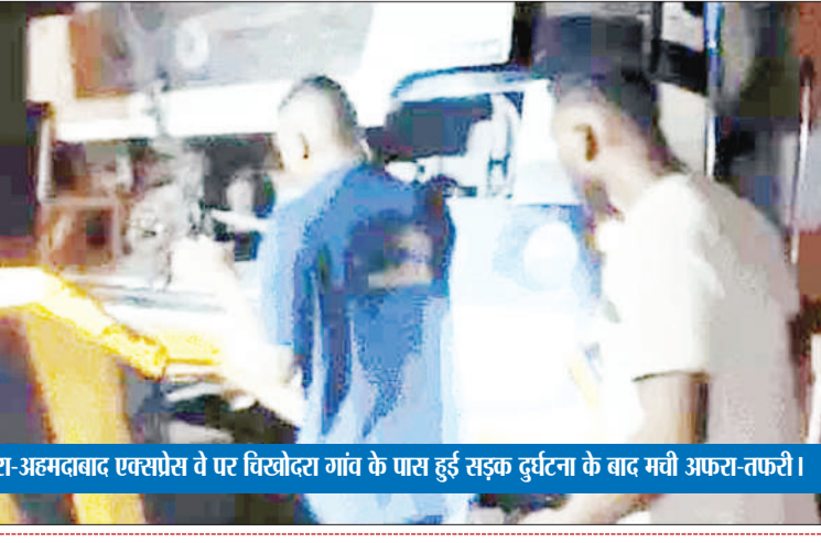
वडोदरा-अहमदाबाद एक्सप्रेस वे पर चिखोदरा गांव के पास हुई सड़क दुर्घटना के बाद मची अफरा-तफरी।

अहमदाबाद। गुजरात के आणंद में सोमवार को एक ट्रक ने खड़ी बस में टक्कर मार दी। हादसे में 6 लोगों के मौत हो गई। वहीं छह से ज्यादा लोग घायल बताए जा रहे हैं। पुलिस ने बताया घटना तड़के साढ़े चार बजे वडोदरा-अहमदाबाद एक्सप्रेस वे पर चिखोदरा गांव के पास हुई। बस अहमदाबाद जा रही थी और टायर पंचर होने की वजह से सड़क के किनारे खड़ी हुई थी। इसी दौरान तेज रफ्तार ट्रक ने टक्कर मार दी। हादसे में पांच लोगों की मौके पर ही मौत हो गई, जबकि एक अन्य व्यक्ति ने अस्पताल में इलाज के दौरान दम तोड़ दिया। अन्य घायलों को भी इलाज के लिए अस्पताल में भर्ती किया गया है।