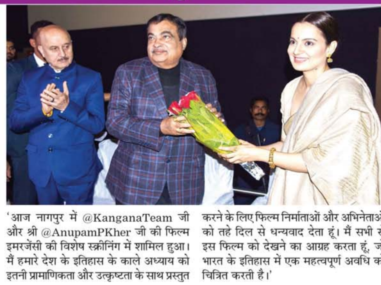
'आज नागपुर में @KanganaTeam जी और श्री @AnupamPKher जी की फिल्म 'इमरजेंसी' की विशेष स्क्रीनिंग में शामिल हुआ। मैं सभी से इमरजेंसी की विशेष स्क्रीनिंग में शामिल हुआ। मैं हमायरे देश के इतिहास के काले अध्याय को इतनी प्रामाणिकता और उत्कृष्टता के साथ प्रस्तुत करने के लिए फिल्म निर्माताओं और अभिनेताओं को तहे दिल से धन्यवाद देता हूँ। मैं सभी से इस फिल्म को देखने का आग्रह करता हूँ, जो भारत के इतिहास में एक महत्वपूर्ण अधीन को चित्रित करती है।'

केंद्रीय सड़क परिवहन और राजमार्ग मंत्री नितिन गडकरी ने शनिवार को नागपुर में कंगना रनौत की फिल्म 'इमरजेंसी' देखी। 'इमरजेंसी' की स्क्रीनिंग पर अनुपम खेरे भी मौजूद रहे। एक्स (पूर्व में ट्विटर) पर स्क्रीनिंग के बाद अपने विचार साझा करते हुए, नितिन गडकरी ने भारत के इतिहास के एक महत्वपूर्ण लेकिन गंभीर अध्याय पर प्रकाश डालने के लिए फिल्म निर्माताओं और अभिनेताओं के प्रति आभार व्यक्त किया। इस अवसर पर कंगना एक बेज रंग की साड़ी में शानदार लग रही थीं और उनके बालों में सुंदर जूड़ा था। जबकि अनुपम खेर गहरे नीले रंग के सूट में थे। स्क्रीनिंग के बाद तीनों ने मीडिया से बातचीत की और फिल्म और इसकी सब्जेक्ट के बारे में विचार साझा किए। बाद में कंगना ने इंस्टाग्राम पर गडकरी को उनके समर्थन के लिए धन्यवाद दिया। स्क्रीनिंग से तस्वीरें साझा करते हुए उन्होंने उन्हें कैप्शन दिया, '#emergency @ gadbari.nitin जी के साथ। 17 जनवरी की रिलीज हो रही है।' मंत्री नितिन गडकरी ने अपने विचार साझा करने के लिए एक्स पर गए। यहां एक पोस्ट में उन्होंने लिखा,