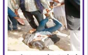
चार आरोपी गिरफ्तार, शेष की तलाश जारी