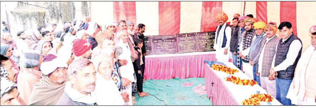
जागरूक टाइम्स संवाददाता

अलवर। नेता प्रतिपक्ष एवं अलवर ग्रामीण विधायक टीकाराम जूली ने अलवर ग्रामीण विधानसभा क्षेत्र के गांव केवा जाट में विभिन्न विकास कार्यों का उद्घाटन व शिलान्यास किया। विधायक निधि कोष से ग्रामीणों को राहत पहुंचाने के उद्देश्य से कराए जा रहे विकास कार्यों की श्रृंखला में नवसृजित पंचायत केरवाजाट के भवन निर्माण, स्कूल के बाउंड्री वाल, इंटरलॉकिंग सड़क तथा सिंगल फेस बोरिंग ने नए प्रतिपक्ष ने उद्घाटन व शिलान्यास किया। जूली ने उपस्थित ग्रामीणों को संबोधित करते हुए कहा कि मालाखेड़ा ब्लॉक के प्रत्येक गांव को चारों तरफ