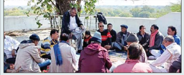
जागरूक टाइम्स संवाददाता