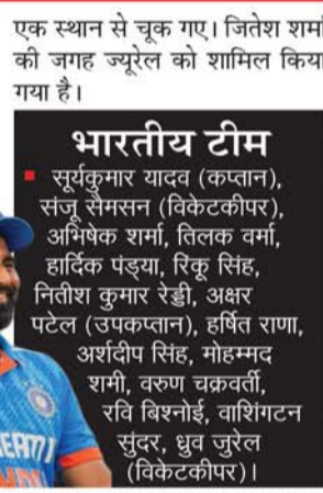
भारतीय टीम : सूर्यकुमार यादव (कप्तान), संजु सैमसन (विकेटकीपर), अभिषेक शर्मा, तिलक वर्मा, हार्दिक पंड्या, रिंकु सिंह, नितीश कुमार रेड्डी, अक्षर पटेल (उपकप्तान), हर्षित राणा, अशरदीप सिंह, मोहम्मद शमी, वरुण चक्रवर्ती, रवि बिश्नोई, वाशिंगटन सुंदर, ध्रुव जुरेल (विकेटकीपर)।

नई दिल्ली। तेज गेंदबाज मोहम्मद शमी इंग्लैंड के खिलाफ 22 जनवरी से कोलकाता में शुरू होने वाले पांच मैचों की टी20 सीरीज के दौरान भारत में वापसी करेंगे। शमी ने आखिरी बार भारत के लिए अहमदाबाद में 2023 विश्व कप फाइनल में खेला था जिसके बाद टखने की चोट के कारण वह टीम से बाहर रहे। उन्होंने सजरी करवाई और एक साल बाद घरेलू क्रिकेट से मैदान पर वापसी की। 34 वर्षीय खिलाड़ी ने रणजी ट्रॉफी के बाद टी20 सैयद मुश्ताक अली ट्रॉफी खेली और अभी विजय हजारे ट्रॉफी में सक्रिय हैं। वह चोट के कारण ऑस्ट्रेलिया भी जा नहीं पाए थे। चयनकर्ताओं ने ध्रुव जुरेल को टीम में दूसरे विकेटकीपर के रूप में चुना है, जिसमें फॉर्म में चल रहे संजु सैमसन पहली पसंद हैं। हालांकि ऋषभ पंत