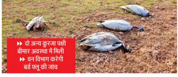
दो अन्य कुरजा पक्षी बीमार अवस्था में मिली वन विभाग करगी बर्ड फ्लू की जांच