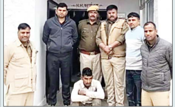
जागरूक टाइम्स संवाददाता