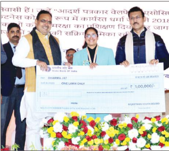
मुख्यमंत्री ने 11 युवाओं को यूथ आइकॉन से किया सम्मानित