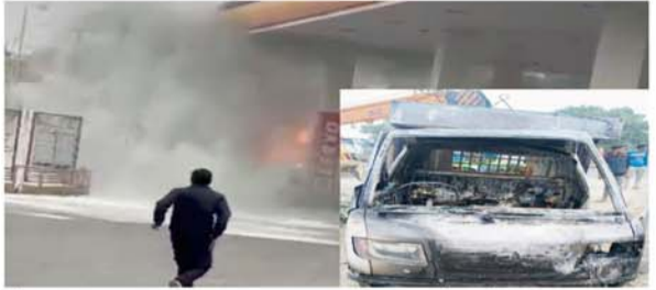
लेकर सुरक्षा व्यवस्था पर भी कई विकारल होती तो बड़ा हादसा भी सवाल खड़े होने लगे हैं। यदि आग हो सकती था।