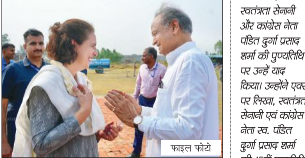
प्रियंका और माकन को दी जन्मदिन की बधाई

जयपुर। राजस्थान के पूर्व मुख्यमंत्री की गॉलब्लैडर की सर्जरी हुई है। उनका यह ऑपरेशन सफलतापूर्वक हुआ है और अब डॉक्टरों ने उन्हें आराम करने की सलाह दी है। अशोक गहलोत ने सोशल मीडिया प्लेटफॉर्म एक्स पर पोस्ट कर यह जानकारी दी है। उन्होंने इस पोस्ट में लिखा, काफी समय से उनकी गॉलब्लैडर की सर्जरी होनी थी, जो अनेक व्यस्तताओं के कारण नहीं हो पाई। शुभचिंतकों की दुआओं से शनिवार को यह सर्जरी सफलतापूर्वक हो गई। उन्होंने आगे बताया कि डॉक्टरों की सलाह के अनुसार वह कुछ दिन रेस्ट पर रहेंगे। इस कारण आमजन से मुलाकात नहीं हो सकेगी। उन्होंने यह भी कहा है कि जल्द ही वे जल्द ही आमजन के उपस्थित होंगे। बता दें कि इससे पहले साल 2019 में अशोक गहलोत का मुंबई के एक अस्पताल में हर्निया का सफल ऑपरेशन किया गया था, जिसकी जानकारी भी गहलोत ने सोशल मीडिया पर साझा की थी।