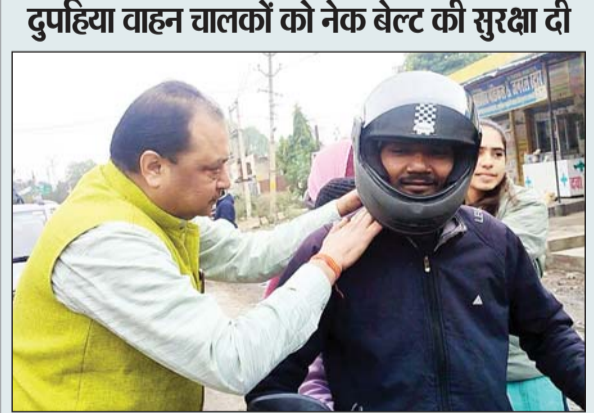
जागरूक टाइम्स संवाददाता

दुपहिया वाहन चालकों को नेक बेल्ट की सुरक्षा दी