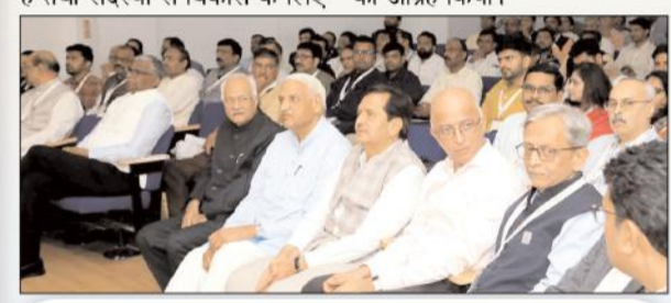
शिखर सम्मेलन में मिला मार्गदर्शन

एक मजबूत पारिस्थितिकी तंत्र के निर्माण में सक्रिय रूप से भाग लेने का आग्रह किया।