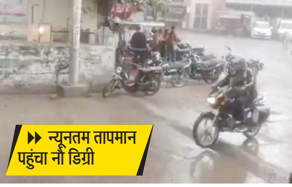
न्यूनतम तापमान पहुंचा नौ डिग्री

पाली। गुरुवार सुबह शहर में घना कोहरा छाया रहा। विजिलिटी काफी कम थी। इसमें वाहन चालकों को भी आने-जाने में परेशानी हुई। अधिकतर वाहन चालक गाड़ी की हैडलाइट जलाकर चल रहे थे। पाली में गुरुवार सुबह का न्यूनतम तापमान नौ डिग्री और अधिकतम तापमान 23 डिग्री। यहां पांच कि.मी. प्रति घंटे की स्पीड से हवा चल रही थी। जो तेज सर्दी का एहसास करा रही थी। मौसम विभाग ने 17 जनवरी को भी कोहरा छाए रहने और बूंदाबांदी होने की चेतावनी जारी कर रखी है। पाली जिले के खिवाड़ा में गुरुवार सुबह हो रही बरसात। पाली के बजरंगबाग रोड पर कोहरे के बीच पैदल जाते शहरवासी। पाली में गुरुवार सुबह भी शहर में घना कोहरा छाया रहा। तेज ठंडी हवा के कारण सर्दी सुबह के समय बढ़ी हुई थी। ऐसे में स्कूल जाने वाले स्टूडेंट और घरों से आवश्यक काम से निकलते लोग गर्म कपड़ों में नजर आए। शहर में कई चाय की थंडियों पर लोग अलाव तोपते हुए चाय की चुस्कियां लेकर सर्दी से राहत पाया का जतन करते दिखे। सुबह के समय सड़कों पर लोगों की आवाजाही कम ही नजर आई। कोहरे