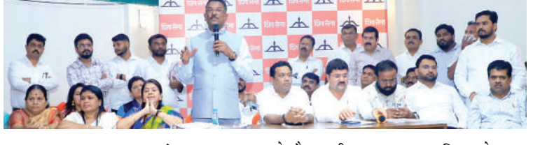
जागरूक टाइम्स संवाददाता

मीरा भायंदर। ठाणे लोकसभा और विधानसभा में महायुति के प्रचंड जीत के बाद शिवसेना अब मीरा भायंदर में सदस्यता अभियान चलाएगी, जिसके अंतर्गत एक लाख नए सदस्य बनाने का लक्ष्य रखा गया है। यह कहना है महाराष्ट्र के परिवहन मंत्री प्रताप सरनाईक का। मीरा भायंदर मनपा चुनाव का बिगुल बज चुका है। 22 जनवरी को कोर्ट का निर्णय आनेवाला है। सरनाईक के अनुसार मनपा चुनाव में भी महायुति का बोलबाला होगा अधिक से अधिक कार्यकर्ताओं-नेताओं को ताकौद देते हुए कहा कि आम जनता तक लोग पहुंचे उनकी समस्या को सुने निवारण का प्रयास करें। 23 जनवरी से नौ फरवरी तक सदस्यता अभियान के तहत आरोग्य शिविर, मतदाताओं के नाम मतदाता सूची में डालने जैसे कई जनहित के कार्य किए जाने वाले हैं। नौ फरवरी को शिवसेना मुख्य नेता एकनाथ शिंदे का जन्मदिन है, इसी को ध्यान में रखते हुए सदस्यता अभियान चलाया जाएगा। सरनाईक शिवसेना जनसंपर्क कार्यालय पहुंचे थे, जहां मनपा चुनाव को लेकर चर्चा की गई। सरनाईक ने पार्टी को मजबूत बनाने के लिए कार्यकर्ताओं नेताओं को सजग और सतर्क रहने के निर्देश दिए। सरनाईक ने कहा कि वे भले ही मंत्री बन गए हों पर वे जनता को पूरा समय दे दें जनता के सीधे संपर्क में रहेंगे। तत्कालीन सीएम एकनाथ शिंदे ने यहां के विकास के लिए तीन हजार करोड़ की निधि उनके प्रयासों के चलते उपलब्ध कराई थी।