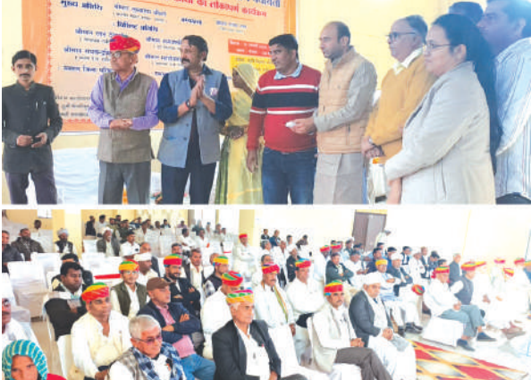
जागरूक टाइम्स संवाददाता