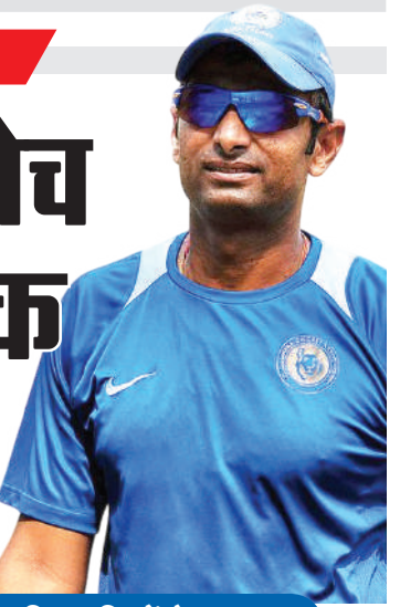
खिलाड़ियों के साथ लगातार तकनीकी समस्या

और विराट कोहली आफ स्ट्रम से बाहर जाती गेंदों पर विकेट गंवाते रहे। कोटक ने घरेलू क्रिकेट में 15 शतक समेत 8000 से अधिक रन बनाए हैं। भारतीय टीम इंग्लैंड के खिलाफ 22 जनवरी से पांच टी20 और तीन वनडे मैचों की सीरीज खेलेगी। सूत्र ने कहा, "भारत ए टीम का दौरा होने वाला है और कोटक आम तौर पर ए टीमों के साथ रहते हैं। वह लेवल तीन के कोच हैं और अतीत में वीवीएस लक्ष्मण के सहायक रह चुके हैं। वह पिछले साल आयरलैंड दौर पर भारत के कोच थे। चूंकि वह एनसीए स्टाफ हैं तो उन्हें कहीं भी भेजा जा सकता है।"