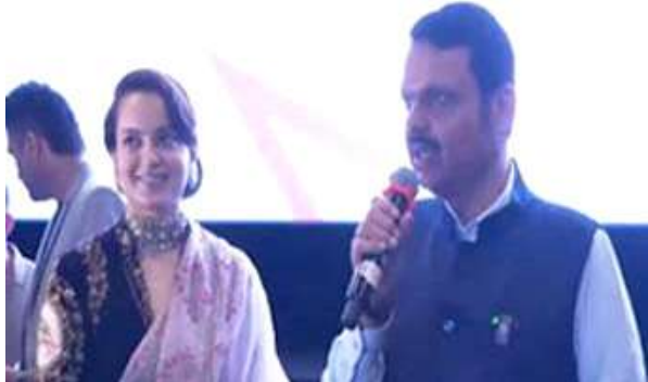
कंगना ने निमाई इंदिरा गांधी की भूमिका

मुंबई। महाराष्ट्र के सीएम देवेंद्र फडणवीस ने गुरुवार को अभिनेत्री कंगना रनौत की फिल्म 'इमरजेंसी' देखी। मंच पर पहुंचे और आपातकाल का सत्य दिखाने के लिए रनौत की तारीफ की। उन्होंने कहा कि मैं कंगना रनौत को इतिहास बधाई देना चाहता हूँ कि इतने महत्वपूर्ण मुद्दे पर उन्होंने फिल्म बनाई। आपातकाल वह समय था, जब सभी लोगों के मानवाधिकार छीन लिए गए थे। मुझे अब भी याद है जब अपने पिता से मिलने में जेल जाता था। मेरे पिता आपातकाल के दौरान जेल में थे और मैं केवल पांच वर्ष का था। इमरजेंसी के दौर को कंगना रनौत ने फिर से एक बार फिल्म के माध्यम से लोगों के बीच लाया है।