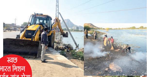
स्वच्छ भारत मिशन अंतर्गत गांव होगा गंदगी मुक्त