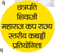
छत्रपति शिवाजी महाराज कप राज्य स्तरीय कबड्डी प्रतियोगिता

मुंबई। राज्य सरकार के खेल एवं युवक सेवा निदेशालय और महाराष्ट्र खेल एसोसिएशन द्वारा बारामती में संयुक्त रूप से आयोजित 23वीं 'छत्रपति शिवाजी महाराज कप राज्य स्तरीय कबड्डी प्रतियोगिता' का उद्घाटन उपमुख्यमंत्री अजित पवार के करकमलों से हुआ। उद्घाटन समारोह के अवसर पर उपमुख्यमंत्री पवार ने प्रतियोगिता में भाग लेने वाले खिलाड़ियों, मार्गदर्शकों, प्रशिक्षकों और कबड्डी प्रेमियों से संवाद किया। इस दौरान उन्होंने घोषणा की कि महाराष्ट्र के आराध्य देव छत्रपति शिवाजी महाराज के नाम पर आयोजित होने वाली कबड्डी, खो-खो, कुस्ती और वॉलीबॉल इन चार राज्य स्तरीय प्रतियोगिताओं के लिए अब तक दी जाने वाली 75 लाख रुपये की धनराशि बढ़ाकर एक करोड़ रुपये की जाएगी। उपमुख्यमंत्री पवार की इस घोषणा से देशी खेलों के प्रचार-प्रसार और खिलाड़ियों के विकास को और अधिक प्रोत्साहन मिलेगा। उनकी इस पहल का खेल जगत में स्वागत हो रहा है।