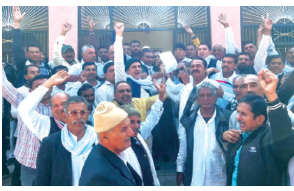
जागरूक टाइम्स संवाददाता