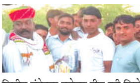
द्वितीय गणेश्वर इलेवन टीम रही जिसे पांच हजार रूपए की राशि के साथ सम्मानित किया गया है।

रानीवाड़ा। रानीवाड़ा उपखंड क्षेत्र के धानोल गांव में पांच दिवसीय धानोल प्रीमियर लीग क्रिकेट प्रतियोगिता का शनिवार को समापन हुआ, जिसमें रानीवाड़ा की एनसीसी टीम प्रथम रही जिनको 11 हजार रूपए की राशि के साथ सम्मानित किया गया। वहीं