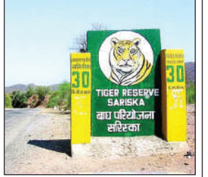
दायरे में 34 होटल

अलवर। राजस्थान के अलवर जिला स्थित सरिस्का टाइगर रिजर्व के कोर, बफर व क्रिटिकल टाइगर हैबीटेट (सीटीईच) परियोजना में चल रहे 76 होटलों पर कार्रवाई की तैयारी शुरू हो गई। प्रशासन ने संबंधित एसडीएम को पूर्व में जारी किए गए नोटिस के आधार पर आगे की कार्रवाई के निर्देश दिए हैं। इससे होटल संचालकों में हड़कंप मचा हुआ है। सुप्रीम कोर्ट ने हाल ही में आदेश जारी किए हैं। जिसमें कहा है कि सरिस्का की जमीन व सीटीईच से एक किमी के दायरे में कोई कॉमर्सियल गतिविधि नहीं चल सकती। एनजीटी ने भी प्रशासन को कार्रवाई के लिए दो सप्ताह का समय दिया है।