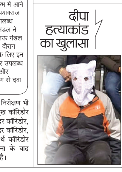
दीपा हत्याकांड का खुलासा

ठाणे। संयुक्त प्रवेश परीक्षा (जेईई) की तैयारी कर रहे छात्रों से तीन करोड़ रुपए से अधिक की धोखाधड़ी करने के आरोप में एक कोचिंग संस्थान के आठ अधिकारियों के खिलाफ आपराधिक मामला दर्ज किया है। तीनों छात्रों की शिकायत के आधार पर पुलिस ने सोमवार को मामला दर्ज किया। संस्थान ने जनवरी 2024 से जेईई के छात्रों से तीन करोड़ 20 लाख रुपए तक की टगी की। छात्रों ने शिकायत में बताया