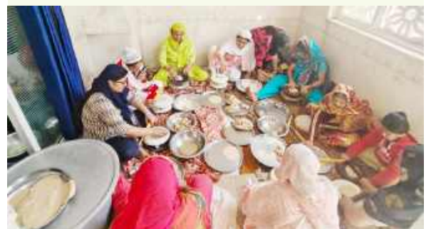
जागरुक टाइम्स संवाददाता

आबूरोड। अंबाजी चौराहे के समीप स्थित गुरुद्वारे में श्री गुरु संगत दरबार का आयोजन किया गया। शब्द कीर्तन किए गए। दोपहर में लंगर प्रसादी का आयोजन किया गया। बड़ी संख्या में श्रद्धालुओं ने शिरकत कर प्रसादी ग्रहण की।