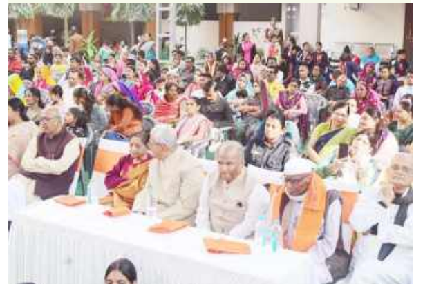
जागरुक टाइम्स संवाददाता