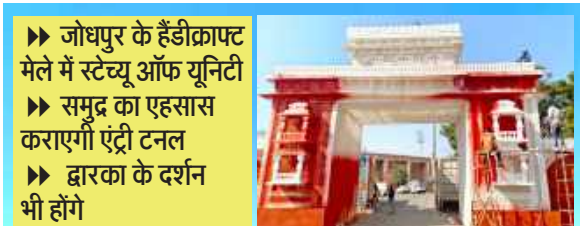
▶▶ जोधपुर के हैंडीक्राफ्ट मेले में स्टेच्यू ऑफ यूनिटी ▶▶ समुद्र का एहसास कराएगी एंटी टनल ▶▶ द्वारका के दर्शन भी होंगे

जोधपुर। पश्चिमी राजस्थान उद्योग हस्तशिल्प मेले को इस बार भव्य व हाईटेक बनाने के लिए मेले की नोडल एजेंसी लघु उद्योग भारती ने पूरी ताकत झोक दी है। भव्य डोम के निर्माण से लेकर सिक्वोरिटी के लिए सीसीटीवी कैमरे लगाए गए हैं। वहीं इस बार पहली बार मेले में सरदार वल्लभ भाई पटेल का 30 फीट का स्टेच्यू लगाया जाएगा। 20 फीट की शिव प्रतिमा भी आकर्षण का केंद्र रहेगी। यही नहीं मेले में आने वाली आम जनता को भेंट डारका और द्वारकाधीश के दर्शन होंगे, मेले में ऐसा टनल बनाया गया है इस टनल में प्रवेश करने के साथ ही हर किसी को यह एहसास होगा कि वह भेंट द्वारका की ही यात्रा कर रहा है और इस टनल में समुद्री जीव, वनस्पतियों का भी जीवंत प्रदर्शन होगा। रामलीला मैदान में 9 जनवरी से 19 जनवरी तक मेले तक आयोजित होने वाले पश्चिमी राजस्थान उद्योग हस्तशिल्प उत्सव भारतीय संस्कृति और राजर्षि राजस्थान की थीम पर आधारित होगा। मेले के पांडाल में जोधपुर के प्रमुख उद्योगों की झांकी सजाई जाएगी, विभिन्न सरकारी योजनाओं की झांकी भी मेले में प्रदर्शित की जाएगी। सरदार पटेल वल्लभभाई पटेल का 150 जयंती वर्ष है और केंद्र सरकार ने