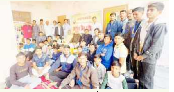
जागरुक टाइम्स संवाददाता