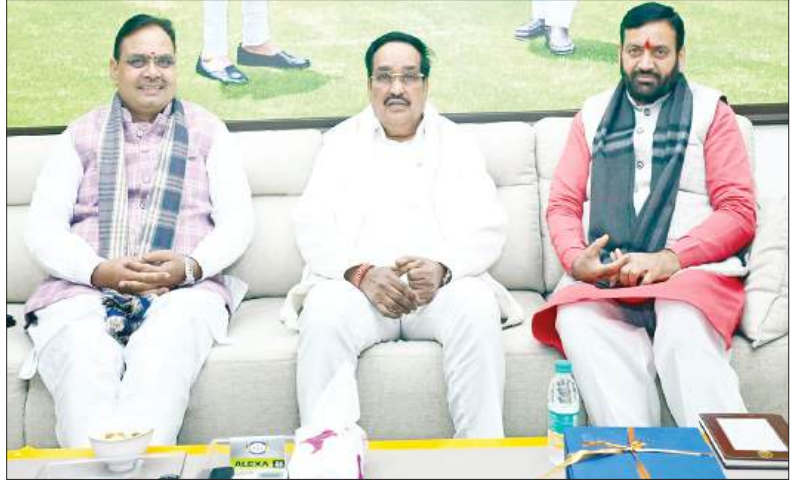
किसानों को जल्द ही यमुना जल का लाभ मिल सकेगा। इस संबंध में केंद्रीय जलसंधि मंत्री सी.आर. पाटिल के समक्ष हरियाणा के सीएम नाथन के साथ मंगलवार देर रात चर्चा पूरी हो गई है। शर्मा ने कहा कि इस जल समझौते की जल्द क्रियान्वयन के लिए दोनों राज्यों के अधिकारियों की एक ज्वाइंट टास्क फोर्स बनेगी, जो की डीपीआर पर काम करेगी।

जागरूक टाइम्स संवाददाता नई दिल्ली/जयपुर। राजस्थान के मुख्यमंत्री भजनलाल शर्मा ने कहा कि राजस्थान के शेखावाटी अंचल के किसानों को जल्द ही यमुना जल का लाभ मिल सकेगा। इस संबंध में केंद्रीय जलसंधि मंत्री सी.आर. पाटिल के समक्ष हरियाणा के सीएम नाथन के साथ मंगलवार देर रात चर्चा पूरी हो गई है। शर्मा ने कहा कि इस जल समझौते की जल्द क्रियान्वयन के लिए दोनों राज्यों के अधिकारियों की एक ज्वाइंट टास्क फोर्स बनेगी, जो की डीपीआर पर काम करेगी। मुख्यमंत्री ने कहा कि यमुना जल समझौते दोनों राज्यों के लिए यह बहुत अच्छा समझौता है। राजस्थान के शेखावाटी अंचल लंबे समय से यमुना जल का इंतजार कर रहा है। अब वो इंतजार खत्म होने जा रहा है और जल्द ही अधिकारियों की ज्वाइंट टास्क फोर्स डीपीआर का काम शुरू करेगी।