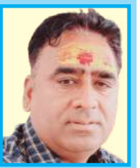
मोहिनपुरी गोस्वामी प्रशासक

ग्राम पंचायत बड़ौद पं.सं, देसूरी जिला -पाली (राज.)