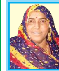
श्रीमती फुल कॅवर प्रशासक

ग्राम पंचायत नाडोल पं.सं, देसूरी जिला -पाली (राज.)