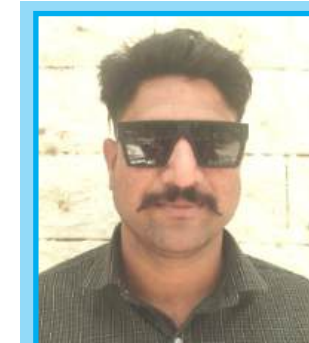
दौलत राईका प्रशासक

ग्राम पंचायत दुदापुरा पं.सं, देसूरी जिला -पाली (राज.)