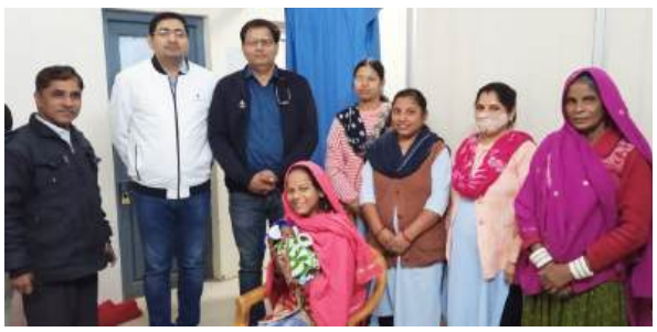
समस्या के कारण शिशु को एनबीएसयू वार्ड में ऑक्सीजन सपोर्ट पर रखा गया। बच्चे को