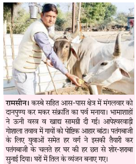
रामसीन। कस्बे सहित आस-पास क्षेत्र में मंगलवार को दानपुण्य कर मकर संक्रांति का पर्व मनाया। भाभाशाहां ने ऊनी वस्त्र व खाद्य सामग्री दी गई। आपेखवाड़ी गौशाला तलाव में गायों को पोष्टिक आहार बांटा। पतंगबाजी के लिए युवाओं समेत हर वर्ग ने इसकी तैयारी कर पतंगबाजी के चलते हर घर की हर छत से शोर-शराबा सुनाई दिया। घरों में तिल के व्यंजन बनाए गए।

जसवंतपुरा। आसमान में सत्रंगी पतंगें, घरों से लेकर सभी जगह वो काटा की आवाज दिनभर गूँजती रही। यह सिलसिला मंगलवार को सुबह से लेकर दिन ढलने तक चलता रहा। मौका था मकर संक्रांति पर्व का। पर्व को लेकर दिनभर आसमान रंगीन पतंगों से गुलजार नजर आया। कस्बे में सुबह से शाम तक हर वर्ग के लोग छतों पर पतंगबाजी करते नजर आए। युवाओं ने डीजे की धुनों के साथ पतंगबाजी का आनंद लिया। अधिकांश लोगों ने परिवार के साथ पतंगबाजी का लुफ्त उठाया। पतंगों के पेच लड़ाने और उन्हें काटने में युवतियां और महिलाएं भी साथ देती नजर आईं। पर्व को लेकर लोगों ने दान पुण्य किया। श्रीराम सेना द्वारा संचालित क्राइडिंग सेंटर व क्षेत्र की गौशालाओं में ग्रामीणों ने हरी घास, लपसी, गुड़ व दलिया खिलाकर पुण्य अर्जित किया। लोगों को अनाज, कपड़े आदि दान किए। मंदिरों में विशेष पूजा अर्चना के साथ विविध धार्मिक आयोजन हुए। लोगों ने तिल के लड्डू बनाकर वितरित किए।