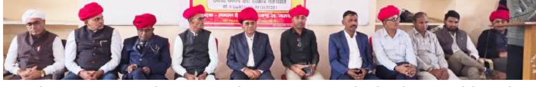
सनाऊ में मयूर महाविद्यालय पंचला में इस परीक्षा का आयोजन किया गया। देवासी समाज की संस्कृति के कुल 150 प्रश्न पूछे गए। प्रश्नों के हल करने के लिए ओएमआर शीट का उपयोग किया गया। इस परीक्षा में जसवंतपुरा ब्लॉक से कुल 410 विद्यार्थियों ने परीक्षा में भाग लिया। कक्षा 9वीं से 12वीं तक 381 विद्यार्थी तथा

जागरूक टाइम्स संवाददाता जसवंतपुरा। देवासी संकल्प सेवा संस्थान राजस्थान द्वारा आयोजित जितेश्वर संकल्प ज्योति प्रतिभा खोज राज्य स्तरीय परीक्षा चतुर्थ का आयोजन जिले के सात ब्लॉकों में एक साथ किया गया। समन्वयक मयूर महाविद्यालय प्राचार्य ने बताया कि जिले के रविंद्रनाथ टैगोर पब्लिक स्कूल प्राथमिक विद्यालय बागोड़ा, देवासी समाज छात्रावास भीनमाल, देवासी समाज छात्रावास चित्तलवाना, राजकीय उच्च माध्यमिक विद्यालय जसवंतपुरा, देवासी समाज छात्रावास गनीवाड़ा, मां शारदा पब्लिक माध्यमिक विद्यालय सांचौर तथा