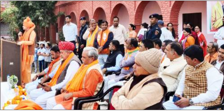
जागरूक टाइम्स संवाददाता