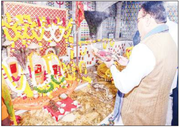
मुख्यमंत्री भजनलाल शर्मा ने रविवार को उदयपुर के घाटारानी माता ( चामुंडा माता ) मंदिर में दर्शन किए। इस दौरान उन्होंने मंदिर में पूजा अर्चना कर प्रदेश की खुशहाली एवं समृद्धि की कामना की।