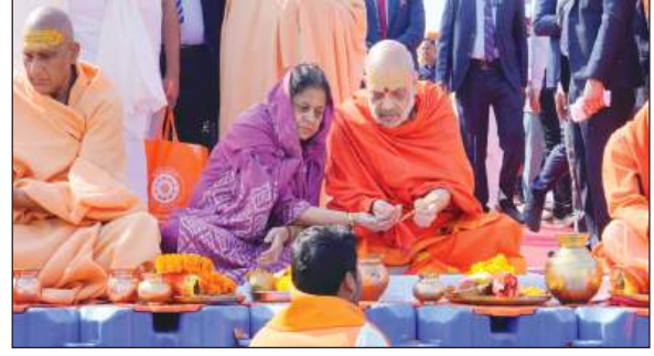
मौनी अमावस्या पर बन रहे दुर्लभ संयोग

मौनी अमावस्या को माधी और माघ अमावस्या के नाम से भी जाना जाता है। इस दिन का शाही स्नान बहुत ही खास माना जा रहा है। इस दिन कई सारे दुर्लभ संयोग बनने जा रहे हैं। दरअसल, 29 जनवरी को चंद्रमा, सूर्य और बुध मकर राशि में त्रिवेणी संयोग बनाएंगे। पांच फरवरी को प्रधानमंत्री नरेंद्र मोदी भी प्रयागराज जाएंगे। रविवार को ही सपा प्रमुख अखिलेश यादव भी संगम में डुबकी लगाने प्रयागराज पहुंचे थे।