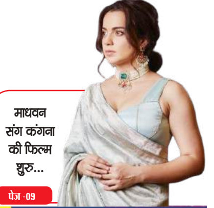
माधवन संग कंगना की फिल्म शुरु... पेज -09

सिरोही, मंगलवार, 28 जनवरी 2025 वर्ष : 18 अंक : 11 पृष्ठ : 12 मूल्य : 2.50 रु.