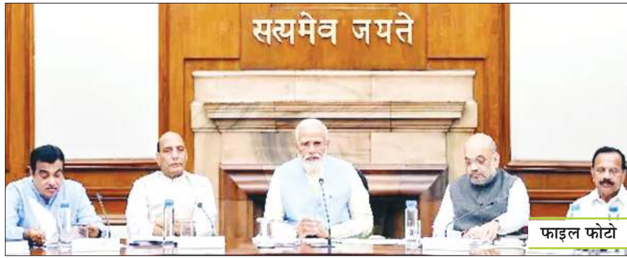
जनवरी 2026 में हो सकता लागू

नई दिल्ली। केंद्र सरकार ने सरकारी कर्मचारियों को बड़ी सौगात दी है और केंद्रीय कैबिनेट ने 8वें वेतन आयोग को मंजूरी दे दी है। जल्दी ही इसके लिए कमिटी का गठन होगा और 8वें वेतन आयोग को बनाने की प्रक्रिया चालू कर दी जायेगी। गुरुवार को केंद्रीय कैबिनेट की बैठक प्रधानमंत्री नरेंद्र मोदी के आवास पर हुई और पीएम मोदी की अध्यक्षता में इस फैसले पर मंजूरी दे दी गई। केंद्रीय कर्मचारियों के