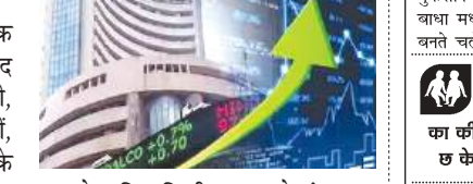
एक शेयर बिना किसी बदलाव के बंद हुआ। एनएसई सेंसेटोरल इंडेक्स में पीएसयू बैंकिंग सेक्टर सबसे ज्यादा 2.55% के बढ़त के साथ बंद हुआ।

सेसेक्स 16 जनवरी को 318 अंक की तेजी के साथ 77,042 के स्तर पर बंद हुआ। निफ्टी में भी 98 अंक की तेजी रही, य 23,311 के स्तर पर बंद हुआ। वहीं, बीएसई स्मॉल कैप 735 अंक की तेजी के साथ 52,308 के स्तर पर बंद हुआ। सेसेक्स को 30 शेयरों में से 20 में तेजी और 10 में गिरावट रही। निफ्टी के 50 शेयरों में से 33 में तेजी और 17 में गिरावट रही। जबकि,