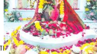
प्राण प्रतिष्ठा के बाद हवन की पूर्णाहुति हुई, जिसके बाद महाप्रसादी में सैकड़ों की संख्या में श्रद्धालुओं ने महाप्रसाद ग्रहण किया। इस अवसर पर मंदिर परिसर को रंग-धिरंगी फूलों से आकर्षक रूप से सजाया गया।

गुरुवार को पूर्ण किए गए। इसके बाद पूर्ण विधि विधान से सभी मूर्तियों की प्राण प्रतिष्ठा और मंदिर पर कलश ध्वजादंड की प्रतिष्ठा की गई। इस दौरान महादेव के गगन भेदी जयकारों लगाए गए जिससे वातावरण शिवमय हुआ। मूर्तियों की