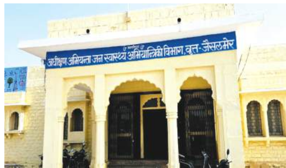
दोपहर दो बजे तक 72 घंटे का संपूर्ण शटडाउन रहेगा। इस दौरान पानी का प्रोडक्शन नहीं हो पाएगा। लेकिन हम