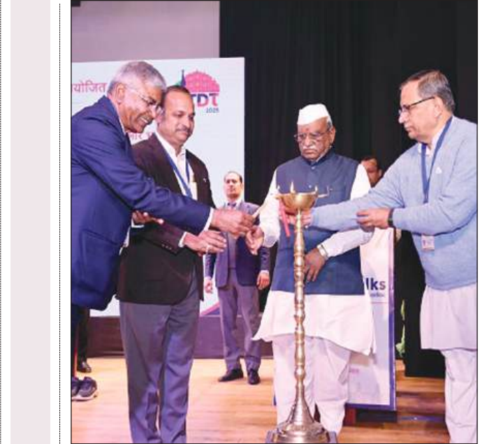
दंडा टॉक्स: 2025 का आगाज