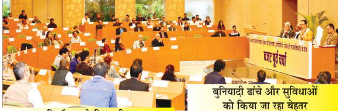
बुनियादी ढांचे और सुविधाओं को किया जा रहा बेहतर

कदम पर मदद मिल रही है। शर्मा शुक्रवार को मुख्यमंत्री कार्यालय में जनजाति क्षेत्रीय विकास विभाग के हितधारकों के साथ आगामी वित्तीय वर्ष 2025-26 के संबंध में आयोजित बजट पूर्व बैठक में चर्चा कर रहे थे। उन्होंने कहा कि राज्य सरकार का प्रयास है कि सभी वर्गों एवं उनके लिए कार्य करने वाली संस्थाओं की भागीदारी सुनिश्चित करते हुए समावेशी बजट तैयार किया जाए। उन्होंने आश्वासन दिया कि जनजाति क्षेत्र के विकास व उत्थान से संबंधित विषयों पर मिले सुझावों का उचित परीक्षण कर आगामी बजट में शामिल करने का प्रयास किया जाएगा, ताकि आगामी बजट में जनजाति क्षेत्रों के विकास को और गति दी जा सके।