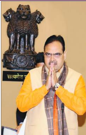
उन्होंने कहा कि संस्थान प्रसव, मातृ-शिशु मृत्यु दर, टीकाकरण, चिकित्सा संस्थानों की उपलब्धता सहित कई मायनों में राजस्थान का प्रदर्शन राष्ट्रीय औसत से बेहतर है।

जयपुर। मुख्यमंत्री भजनलाल शर्मा ने कहा कि चिकित्सक संवेदनाओं के साथ कर्तव्य का निर्वहन करते हुए स्वस्थ राजस्थान की हमारी संकल्पना को साकार करने में अहम भागीदारी निभा रहे हैं। प्रदेशवासियों को बेहतर चिकित्सा सुविधाएं उपलब्ध कराना हमारे लिए सर्वोच्च प्राथमिकता है। हम 'आपगो स्वस्थ राजस्थान' की संकल्पना पर काम करते हुए उत्कृष्ट एवं खूबहाल राजस्थान बनाने के लिए प्रतिबद्ध हैं। मुख्यमंत्री ने कहा कि चिकित्सक अपने क्षेत्र के विशेषज्ञ हैं तथा आगामी बजट में इनके द्वारा दिए गए सुझाव आमजन के लिए लाभकारी हैं। शर्मा शुक्रवार को मुख्यमंत्री कार्यालय में चिकित्सा एवं स्वास्थ्य क्षेत्र से जुड़े संस्थानों के प्रतिनिधियों के साथ बजट पूर्व संवाद का संवोधित कर रहे हैं। उन्होंने कहा कि राज्य सरकार स्वास्थ्य सेवाओं के विस्तार एवं सुदृढीकरण के लिए निरंतर कार्य कर रही है। चिकित्सा के महत्व को समझते हुए हमने गत बजट में चिकित्सा के लिए कुल बजट का रिकॉर्ड 8.26 प्रतिशत आवंटित किया।