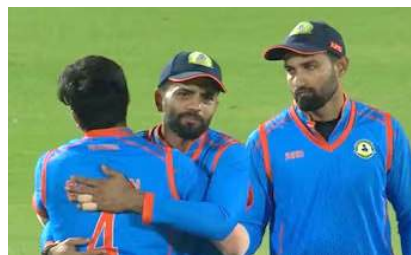
आज कर्नाटक से होगा खिताबी मैच

मुंबई। विदर्भ की टीम विजय हजारे ट्रॉफी 2024-25 को दूसरी फाइनलिस्ट बनी। ट्रान्समिंट के दूसरे फाइनल में विदर्भ ने महाराष्ट्र को 69 रनों से हराया। अब विजय हजारे ट्रॉफी का फाइनल मैच विदर्भ और कर्नाटक के बीच खेला जाएगा। खिताबी मुकाबला 18 जनवरी को वडोदरा के कोटांबी स्टेडियम में होगा। वहीं सेमीफाइनल मैच की बात करें तो विदर्भ ने तावड़तोड बल्लेबाजी की बदीलत जीत हासिल की। हालांकि महाराष्ट्र ने भी बल्लेबाजी में दम दिखाया, लेकिन जीत की लाइन पार नहीं कर सके। गौर करने वाली बात यह है कि विदर्भ और महाराष्ट्र ने 300-300 रनों का आंकड़ा पार किया। वडोदरा के कोटांबी स्टेडियम में खेले गए मुकाबले में महाराष्ट्र ने टॉस जीतकर बॉलिंग करने का फैसला किया, जो उनके लिए गलत साबित हुआ।