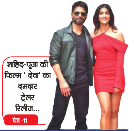
शाहिद-पूजा की फिल्म 'देवा' का दमदार ट्रेलर रिलीज... पृष्ठ-11

सिरोही, शनिवार, 18 जनवरी 2025 | वर्ष : 18 | अंक : 02 | पृष्ठ : 12 | मूल्य : 2.50 ₹.