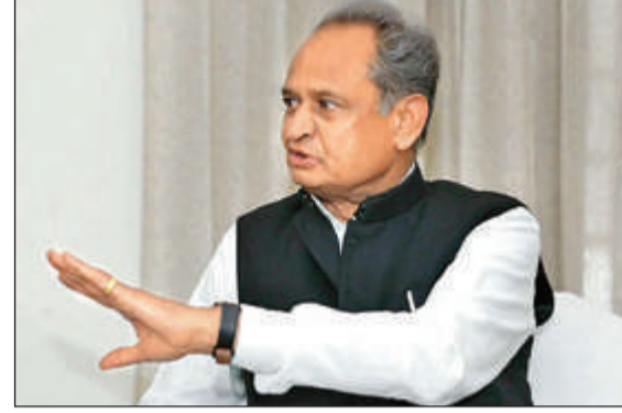
गहलोत ने लिखा कांग्रेस सभी जाति, धर्म, वर्ग और समुदायों को तो साथ लेकर चलती ही है। साथ ही जो लोग कांग्रेस की यात्रा में कभी न कभी साथ रहे, योगदान दिया। उनको पार्टी छोड़ने या विचारधारा बदलने के बाद भी सम्मान देती है। इसीलिए कांग्रेस के नए कार्यकर्ता में उन लोगों की भी तस्वीरें लगी हैं, जो आज कांग्रेस में नहीं हैं। इन्होंने किसी हित के लिए कांग्रेस के साथ विश्वासघात किया।

जागरूक टाइम्स संवाददाता जयपुर। पूर्व सीएम अशोक गहलोत ने भाजपा और कांग्रेस की विचारधाराओं में तुलना करते हुए भाजपा को संकीर्ण सोच वाली पार्टी कहा है। गहलोत ने सोशल मीडिया पोस्ट के जरिए भाजपा पर तंज कसा है। गहलोत ने एक्स पर लिखा ये कांग्रेस है। यह भाजपा और कांग्रेस की विचारधारा का बुनियादी अंतर है। भाजपा का काम संकीर्ण विचारधारा रखकर कांग्रेस नेताओं के नाम से बने संस्थानों का नाम बदलना, देश के लिए कुर्बानी तक दे चुके कांग्रेस नेताओं को अपशब्द बोलना रह गया है। कांग्रेस बड़ा दिल रखने वाली पार्टी है। कांग्रेस की विचारधारा भारत की विचारधारा है, जो सहअस्तित्व में विश्वास करती है।