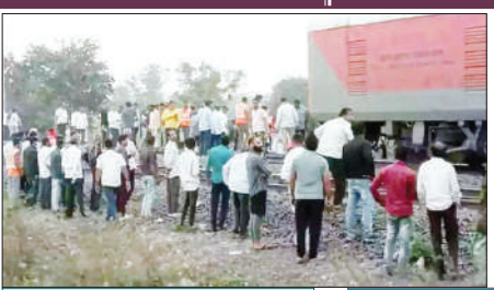
ब्रेक लगने पर ट्रेन के पहिए से निकला धुआं

जलगांव एसपी ने 12 लोगों की मौत की पुष्टि की है। 40 पैसंजर्स के घायल होने की खबर है। सेंट्रल रेलवे के भुसावल डिब्बाजन के आधिकारिक सूत्रों ने बताया कि जहां घटना हुई, उस जगह पर शाप टर्न था। इस वजह से दूसरे ट्रेक पर बैठे पैसंजर्स को ट्रेन के आने का अंदाजा नहीं लगा। यही वजह रही कि कर्नाटक संपर्क क्रांति से इतनी बड़ी संख्या में लोग कुचले गए। सेंट्रल रेलवे के सीपीआरओ स्वप्निल निला ने