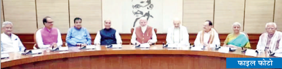
प्रधानमंत्री नरेंद्र मोदी की अध्यक्षता में हुई है। पीयूष गोयल के मुताबिक कैबिनेट ने जूट के न्यूनतम समर्थन मूल्य को बढ़ा दिया है। 2025-26 के लिए रॉ जूट की एमएसपी में 6

नई दिल्ली। बजट से पहले कृषि और स्वास्थ्य को लेकर मोदी कैबिनेट ने बड़ा फैसला किया है। बुधवार को कैबिनेट बैठक में जूट की एमएसपी बढ़ाने और नेशनल हेल्थ मिशन को अगले पांच साल तक चालू रखने का फैसला किया है। बैठक के बाद यह जानकारी केंद्रीय मंत्री पीयूष गोयल ने दी है। कैबिनेट की बैठक