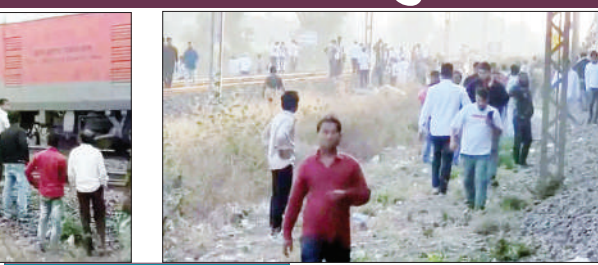
बढ़ सकता है मौत का आंकड़ा