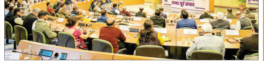
जागरूक टाइम्स संवाददाता जयपुर। मुख्यमंत्री भजनलाल शर्मा ने कहा कि एक सशक्त और समृद्ध समाज के निर्माण में एनजीओ, सिविल सोसाइटी और उपभोक्ता मंच की अहम भूमिका है। इनका समाज पर बहुत गहरा प्रभाव होता है तथा वे राज्य सरकार की योजनाओं को जना तक पहुंचाने का काम करते हैं। उन्होंने कहा कि राज्य सरकार बजट में प्रत्येक वर्ग की जरूरतों का समावेश कर सभी को सुझावों का यथासंभव समाहित करेगी जिससे सबका साथ, सबका विकास के संकल्प को गति मिले।

मुख्यमंत्री शर्मा बुधवार को मुख्यमंत्री कार्यालय में एनजीओ, सिविल सोसाइटी और उपभोक्ता मंच के प्रतिनिधियों से बजट पूर्व चर्चा को संबोधित कर रहे थे। उन्होंने कहा कि एनजीओ, सिविल सोसाइटी एवं उपभोक्ता मंच जैसे संगठन अपने क्षेत्र के विशेषज्ञ हैं तथा इनके अनुभव का लाभ जनता को मिलना चाहिए। उन्होंने कहा कि राज्य सरकार पंडित दीनदयाल उपाध्याय तथा भीमराव अम्बेडकर के अंत्योदय की अवधारणा पर काम कर रही है जिसके तहत अंतिम पंक्ति पर खड़े व्यक्ति को योजनाओं का लाभ मिले तथा वे समाज की मुख्यधारा से जुड़ सकें।