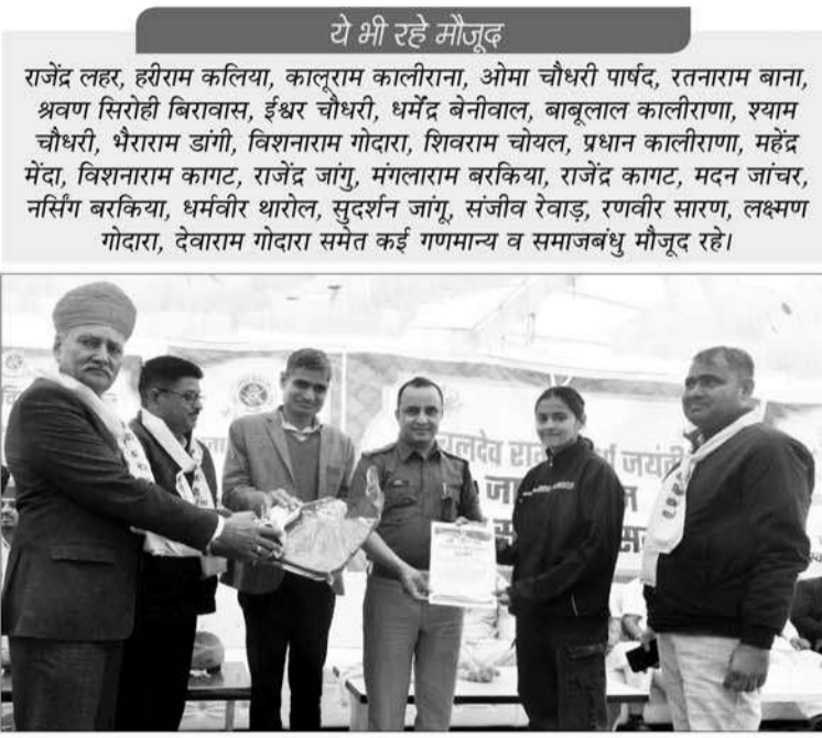
शिक्षा को लेकर जागृत किया और हमें उनके आदर्शों पर चलकर शिक्षा के क्षेत्र में निरंतर आगे बढ़ना होगा। इसलिए समाज की प्रतिभाओं को प्रोत्साहित करना होगा, जिससे दूसरी पीढ़ी भी उनसे प्रेरित होकर आगे बढ़ सके।