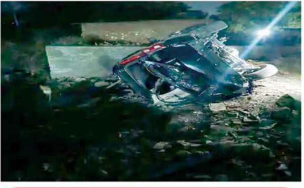
गुहार लगाता रहा युवक घटना के दो वीडियो सामने आए हैं। पहले वीडियो में एक युवक घायलों के पास बैठा मौजूद भीड़ से उन्हें अस्पताल ले जाने के लिए गाड़ी मंगवाने की गुहार लगाता नजर आ रहा है। वीडियो में बार-बार कोई घायल भेरे सांवरा सेठ-भेरे सांवरा सेठ कह रहा है। वीडियो में सभी घायल नजर आ रहे हैं। हादसा इतना भीषण था कि गाड़ी के पुर्जे-पुर्जे बिखर गए हैं। पीछे का हिस्सा पूरा एसयूवी से ही अलग हो गया।

उदयपुर। तेज रफतार स्काॅर्पियो पलटने से उसमें सवार दो लोगों की मौत हो गई। दो युवक गंभीर रूप से घायल हैं। गाड़ी में पांच लोग सवार थे। सभी शादी समारोह से लौट रहे थे। स्काॅर्पियो के परखच्चे उड़ गए। घायल भीड़ से मिनटों करता रहा कि अस्पताल पहुंचा दो। फिर भी किसी का दिल नहीं पसीजा। घायलों को कोई अस्पताल लेकर नहीं गया। घटना का सीसीटीवी फुटेज भी सामने आया है। हादसा उदयपुर के बड़गांव इलाके में बड़गांव रोड पर शुक्रवार देर रात करीब 10 बजे हुआ।