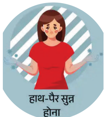
हाथ-पैर सुन्न होना