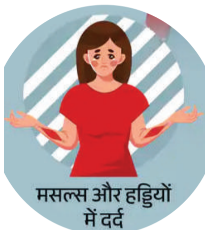
मसल्स और हड्डियों में दर्द