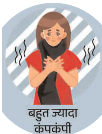
बहुत ज्यादा कंपकंपी