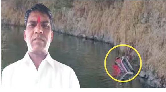
को उनकी ब्रेजा कार सहित गुजरत में फेंक दिया और मामले को हादसा में एक खदान में 50 फीट गहरे पानी बताने की कोशिश की।