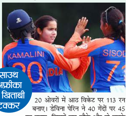
साउथ अफ्रीका से खिताबी टक्कर