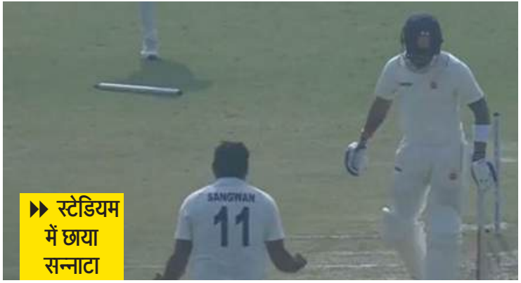
स्टेडियम में छाया सन्नाटा